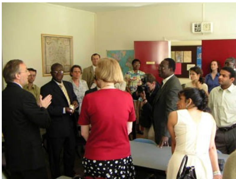
Réunion au stage technique international d'archives 2004 (Paris)